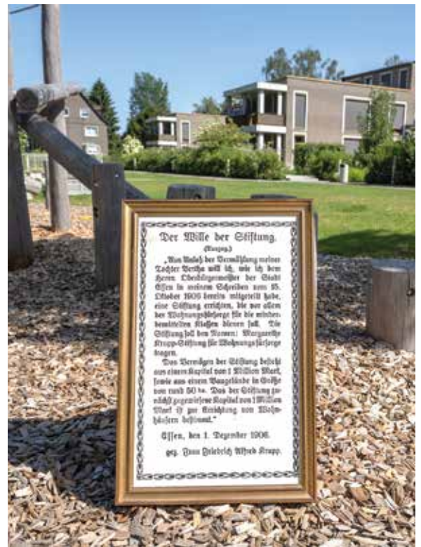
Die Original-Gründungsurkunde befindet sich im Ruhr Museum, eine Kopie besitzt die MKS.

Die 1906 von Margarethe Krupp gegründete Stiftung ist bis heute Deutschlands größte Wohnungsstiftung. In den 1870er Jahren lässt Alfred Krupp verstärkt Werkswohnungen und -siedlungen bauen. Sein Sohn Friedrich Alfred führt das Sozialwerk fort. Nachdem er 1902 verstirbt, wird seine Tochter Bertha Erbin des Unternehmens Krupp. Sie ist noch minderjährig und ihre Mutter Margarethe Krupp übernimmt die Aufgaben. Sie erwirbt ein zusammenhängendes Gelände im Essener Südwesten. Am 15. Oktober 1906 heiratet Bertha Krupp den preußischen Diplomaten Gustav von Bohlen und Halbach. Aus Anlass der Vermählung stellt Margarethe Krupp den nördlichen Teil des Besitzes für die Margarethe Krupp-Stiftung für Wohnungsfürsorge zur Verfügung und spendet zudem eine Millionen Mark. Am 1. Dezember 1906 wird die Stiftungsurkunde unterzeichnet, 1909 mit dem Bau der Margarethenhöhe begonnen. Das Ruhr Museum plant am 1. und 2. Dezember diesen Jahres gemeinsam mit der Margarethe Krupp-Stiftung gleich mehrere Vorträge und Veranstaltungen zum Thema.