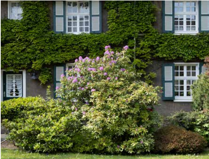
Das Thema Nachhaltigkeit sieht die Margarethe Krupp-Stiftung ganzheitlich. Auch der wilde Wein an den Hausfassaden spielt dabei eine Rolle.

Die Stiftung hat sich auf freiwilliger Basis Nachhaltigkeitsziele zu den Themen Ökologie, Soziales und Ökonomie gesetzt und diese vom Wirtschaftsprüfer "forvis mazars" prüfen und testieren lassen. Diese werden konsequent verfolgt, um eine positive Wirkung auf Umwelt, Unternehmen und Gesellschaft zu erreichen.