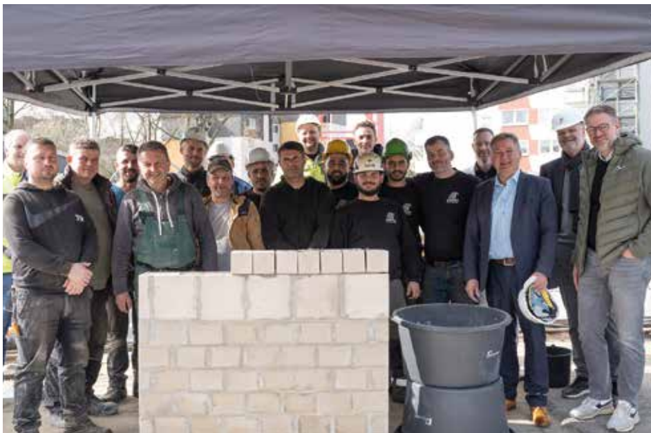
Das Bauprojekt „Greenliving“ am Helgolandrings, hier ein Bild von der Grundsteinlegung, nimmt mehr und mehr Gestalt an.

Wer den Baufortschritt "live" beobachten möchte, kann dies auf der Homepage der Stiftung tun. Hier gibt es einen Link zur Webcam : www.margarethe-krupp-stiftung.de