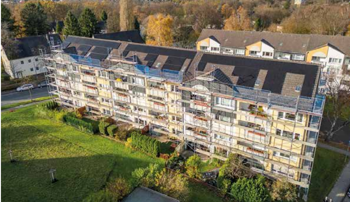
Aus der Vogelperspektive erkennt man die PV-Module.

A uf dem Weg zur Klimaneutralität kooperiert die Margarethe Krupp-Stiftung mit den Stadtwerken Essen. Auf der "Neuen" Margarethenhöhe sind auf drei Häusern bereits Photovoltaik-Module auf die Dächer gebracht worden. Nun geht es darum, grünen Strom in die Wohnungen zu transportieren. Doch vorerst müssen technische Vorkehrungen getroffen und auf den Weg gebracht werden.