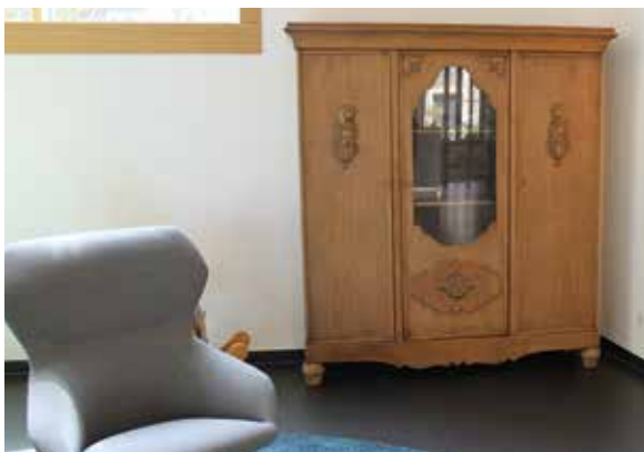
Ein Metzendorf-Schrank ist im Foyer der MKS zu sehen.

16.30 eine Führung speziell für Familien. Die Metzendorf-Möbel sind allerdings nicht expliziter Bestandteil der Führungen. Wer Metzendorf-Möbel aus nächster Nähe betrachten will, sollte sich die Musterwohnung im Rahmen eines Spaziergangs über die Höhe ansehen. Sowohl das Ruhr Museum als auch die Bürgerschaft organisieren regelmäßig sonntags solche Begehungen. Wenn jemand noch im Besitz von original Metzendorf-Möbeln ist oder sich an Geschichten rund um seine Möbel erinnert, gerne eine E-Mail schreiben an: info@margarethe-krupp-stiftung.de axel.heimsoth@ruhrmuseum.de