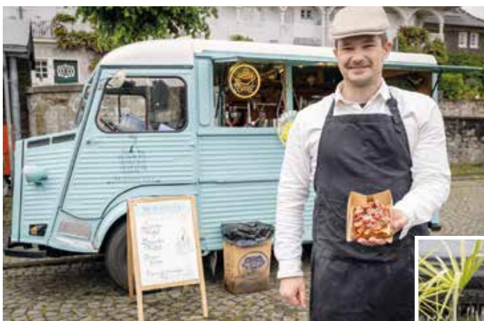
Schönes für die Seele von "Blumen bei Chris" (Bild rechts) oder etwas Gutes für den Gaumen vom "Waffle Guy" (Bild oben).

Die nächsten Termine sind jeweils am zweiten Mittwoch im Monat, am 8. Juli, 12. August und 9. September, immer von 16 bis 21 Uhr.