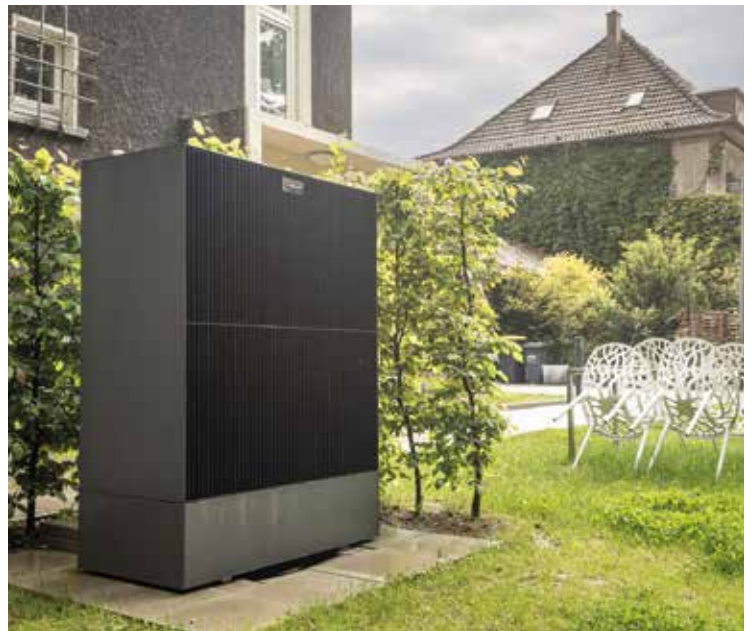
Beispiel für eine Wärmepumpe, die bereits im Stillen Winkel installiert wurde.