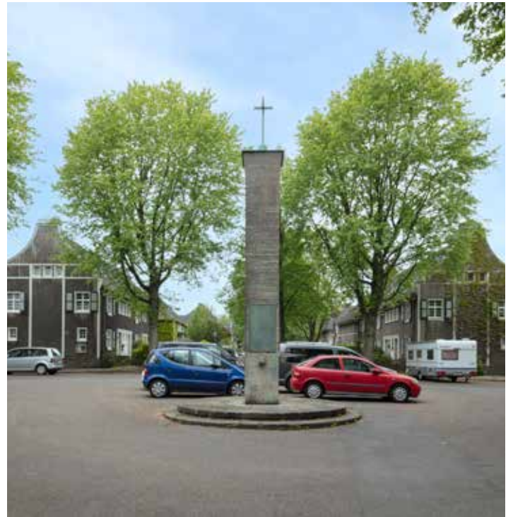
Die Umgestaltung des Giebelplatzes soll eine Steigerung der Aufenthaltsqualität durch mehr Grün auf dem Platz bewirken.

D ie Folgen des Klimawandels, etwa durch Hitzewellen und starke Regenfälle, stellen die Kommunen vor große Herausforderungen. Die Stadt Essen hat 2023 den Startschuss für die klimaresiliente Umgestaltung des Giebelplatzes gegeben. "Klimaresilienz" bedeutet konkret, Städte und Quartiere widerstandsfähiger gegen die Folgen des Klimawandels zu machen. Ziel ist es, den Platz umweltfreundlicher und lebenswerter zu gestalten.