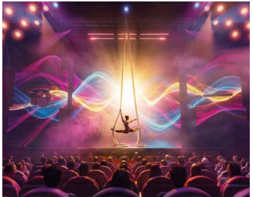
Das GOP an der Rottstraße wird derzeit komplett entkernt. So soll es dann im September aussehen.